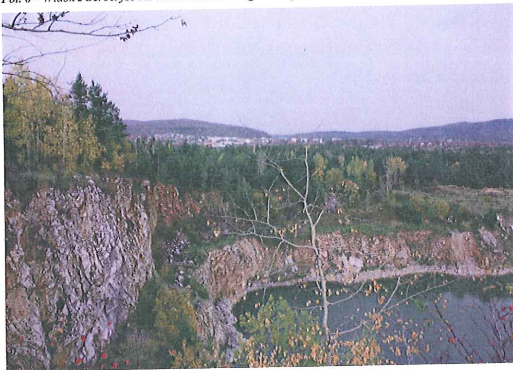
Fot. 6 – Widok z Berberysówki na Kamieniołom Zgórsko i przełom Bobrzy w Słowiku.

należy zwracać uwagę na godziny prowadzenia robót strzałowych i w tym czasie nie przebywać w pobliżu.