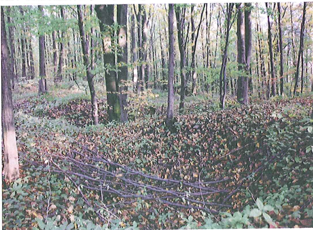
Fot. 4 – Powierzchniowe ślady historycznego górnictwa kruszcowego na Górze Miejskiej.

jest mały łomik, z którego wydobywano wapienne bloki skalne ( historyczny marmurołom Dobrzączka).