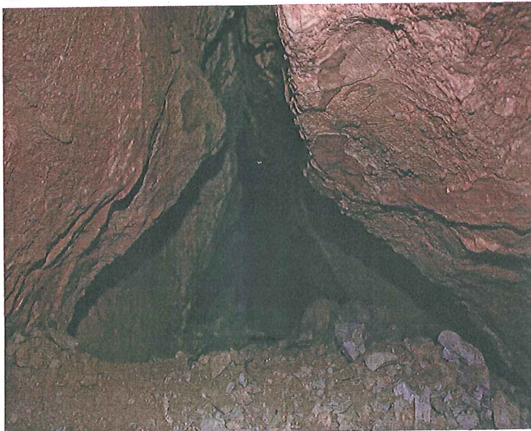
Fot. 7 – Jeden z korytarzy Jaskini Odstrzelonej.