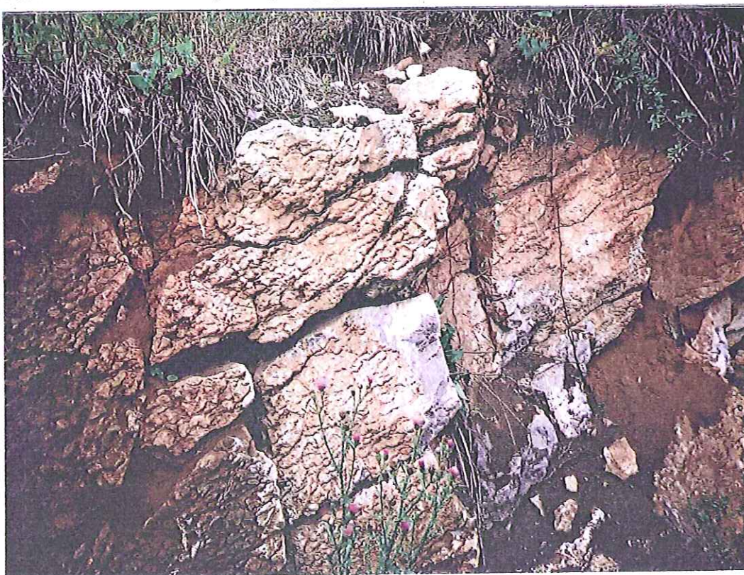
Fot. 5 – Powierzchniowe ślady historycznego górnictwa kruszcowego na Ołowiance