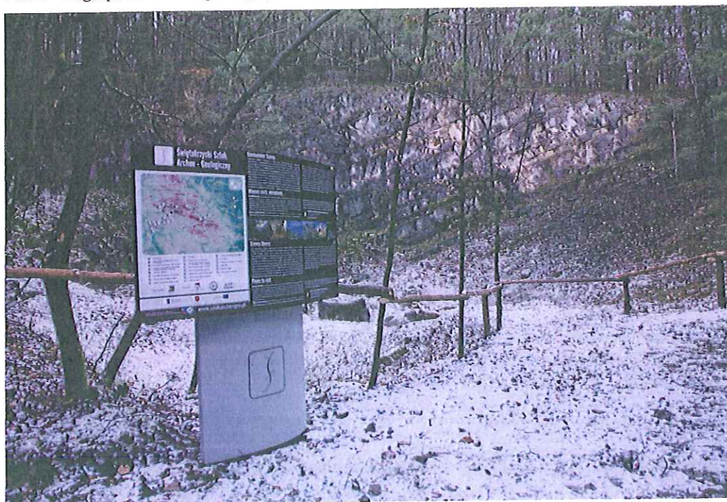
Fot. 3 – Zagospodarowanie geoturystyczne Kamieniołomu Szewce na Górze Okraglicy.

Wyrobisko położone jest po wschodniej stronie wzniesienia Okraglica w Paśmie Bolechowickim, na terenie Chęcińsko-Kieleckiego Parku Krajobrazowego. Jest jednym z najbardziej znanych marmurołomów na terenie Gór Świętokrzyskich, w którym eksploatacja prowadzona była co najmniej od pierwszej połowy XVII wieku. Opisywane geostanowisko aktualnie jest nieczynnym wyrobiskiem górniczym, w którym odsłaniają się jasnoszare wapienie dewońskie o odcieniu lilowym lub fioletowym, zawierające liczne amfipory. W głównej zachodniej części wyrobiska odsłaniają się wapienie, które zapadają pod kątem 20-25° na południe. Na ścianach odsłonięcia możemy zapoznać się z techniką górniczą stosowaną przy eksploatacji bloków skalnych ze złoża.